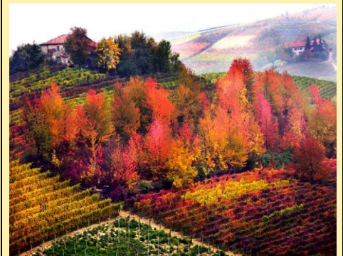
Piedmont, Italy Second half of October