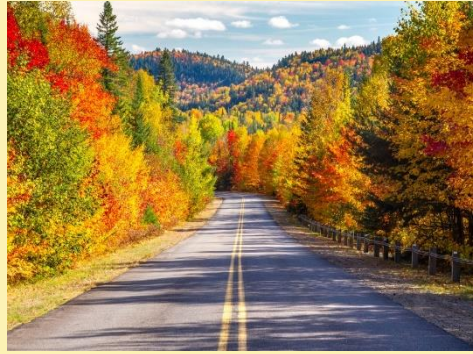
Northern Ontario and Quebec, Canada – Late September, early October