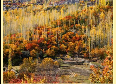
Hunza Valley, Pakistan Mid to late October