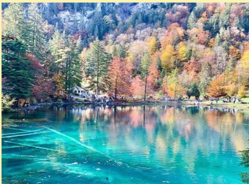
Bern, Switzerland Late September to early October