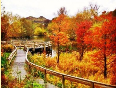
Edinburgh, Scotland Late September, October