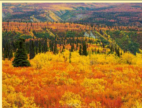
Denali National Park, Alaska Mid August to early September