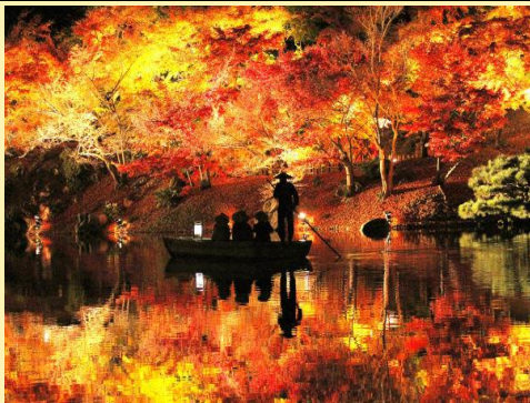
Ritsurin Garden, Takamatsu, Japan Late October thru November