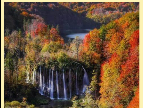
Plitvice National Park, Croatia Mid September to Mid October