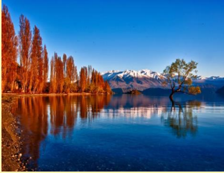
Wānaka, New Zealand – Late March to May