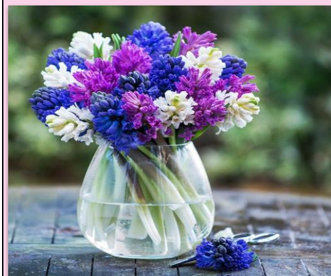
Hyacinths France – the last Sunday of May/first Sunday of June