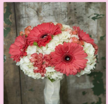
Gerberas India – 2 nd Sunday of May