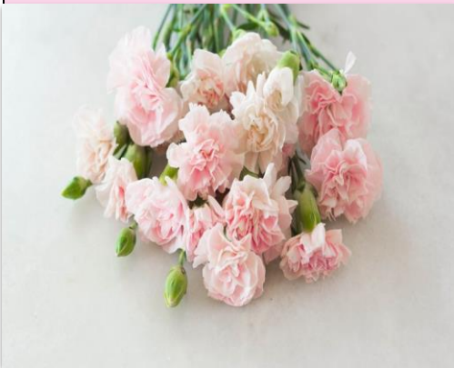
White and Pink Carnations USA – the 2 nd Sunday of May