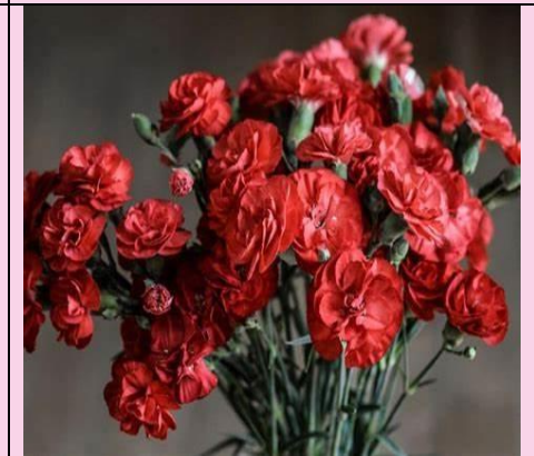
Red carnations Japan – the 2 nd Sunday of May