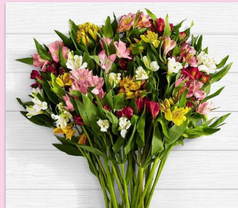
Mixed spring bouquet Peru – the 2 nd Sunday of May