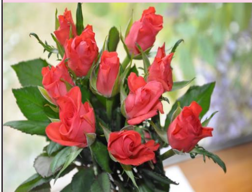
Multicolored roses Italy – the 2 nd Sunday in May