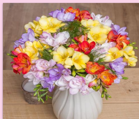
Freesias Germany – the 2 nd Sunday of May