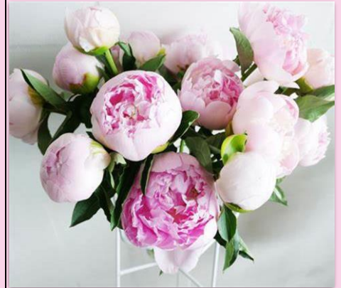
Peonies UK – Sunday, March 19 th