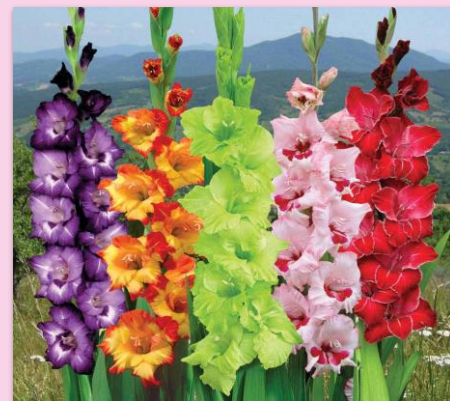
Gladiolus or marigold Mexico – May 10 th