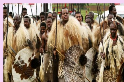
インクワラ エスワティニ王国/南アフリカ （12月下旬）