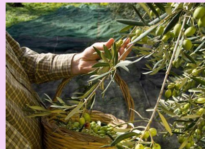
オリバガンド マジョーネ/イタリア（11月） 2日間にわたるオリーブの収穫祭