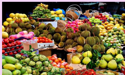
チャンタプリフルーツフェア タイ（5月下旬） エキゾチックなフルーツの市場