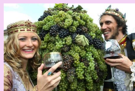
ズノイモ - ワイン収穫祭 南モラヴィア州/チェコ共和国 （9月中旬）