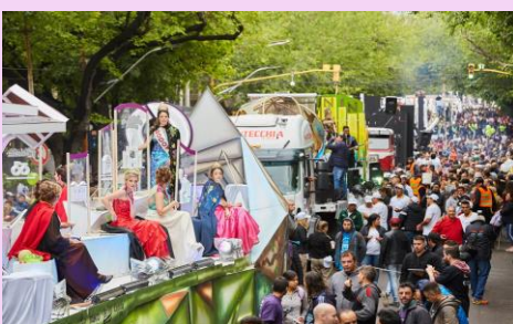
ベンディミア メンドーサ市/アルゼンチン（2月下旬） 全国ブドウ収穫祭