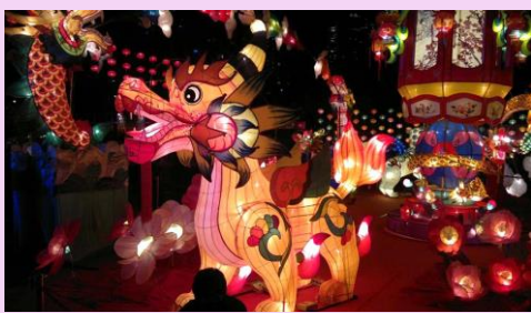
中秋節 中国・台湾・ベトナム（9月中旬）