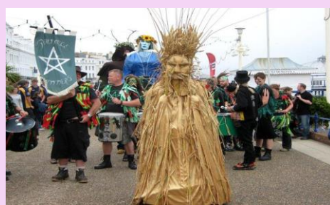
ラマス・フェスティバル イギリス（8月1日） イングランド、スコットランド、ウェールズ、 北アイルランドでの小麦の初収穫