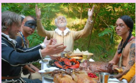
感謝祭 - プリマスプランテーション マサチューセッツ州 ピルグリムが初めて小麦の収穫に成功したことを 記念する3日間のお祭り