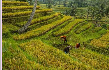
お米の収穫祭 バリ/インドネシア お正月に続いて