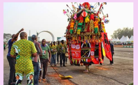
ヤム芋祭り ガーナ/南アフリカ（8～9月） ヤム芋の収穫を祝う。パプアニューギニアとナ イジェリアでも同様の祭りが同様に行われる