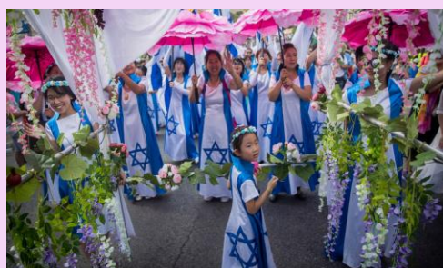
スコット（仮庵祭） イスラエル（9・10月） 秋の収穫に感謝する仮庵のお祭り