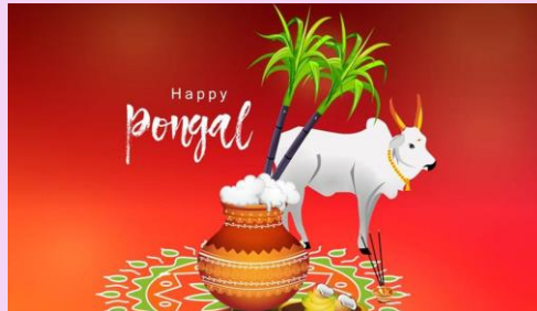
ポンガル タミル/インド（1月中旬） ヒンズー教の収穫祭