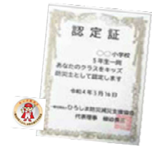
キッズ防災士の認定証と認定バッジがもらえる!