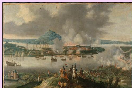
1986年 - オランダとシリー諸島が平和条約に調印しました。