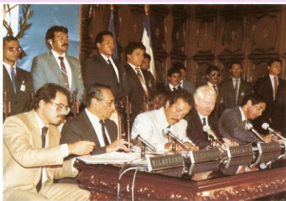
1987年 - 5人の中米大統領がグアテマラで和平協定に調印しました。