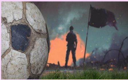
1980年 - ホンジュラスとエルサルバドルが「サッカーの戦い」後に和平に署名しました。