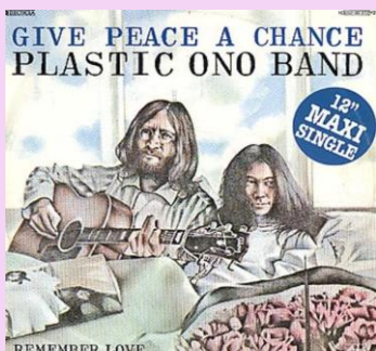
1969年 - ジョン・レノンとオノ・ヨーコが「Give Peace a Chance」を録音しました。