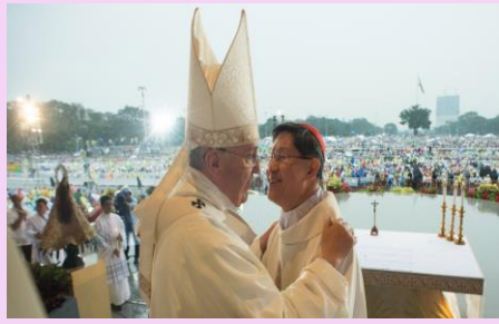
2015 - Mass in Manila, Philippines 教皇フランシスコは信者に平和を促進するよう促しました。