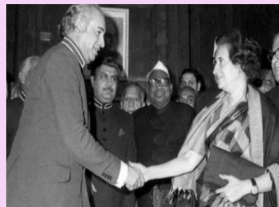
1966年 - インドとパキスタンが平和条約に調印しました。