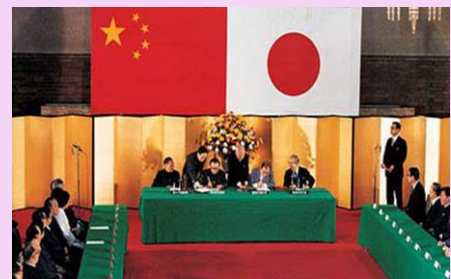
1978年 - 中国と日本が平和と友好の条約に調印しました。