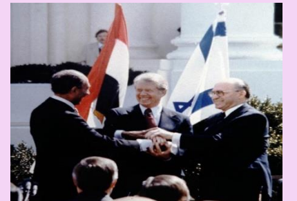
1983年 - イスラエルとレバノンが平和条約に署名しました。