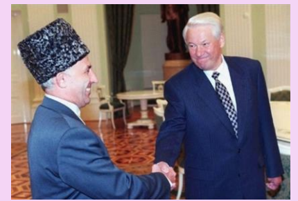
1997年 - ロシアとチェチェンは400年にわたる紛争の後、和平協定に署名しました。