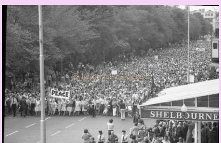
1976年 - 10,000人の北アイルランドの女性がベルファストで平和を訴えるデモを行いました。