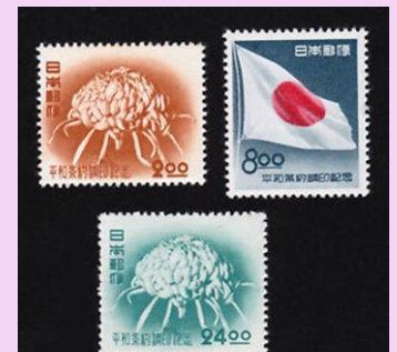
1951年 - 日本は48カ国と平和条約を締結しました。