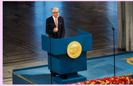
2012年 - ノーベル平和賞は、60年以上にわたる平和への貢献を称えられ、オスロにあるEUに授与されました。