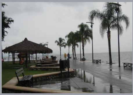
Mexico May to October