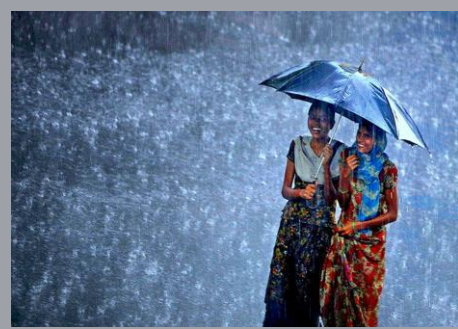
India June to September