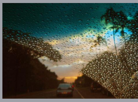
Hawaii November to March