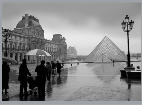
Europe March through May