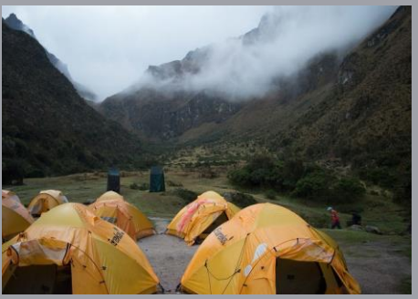
Peru January to April