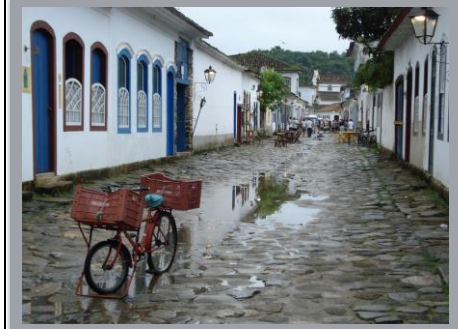
Brazil December to February