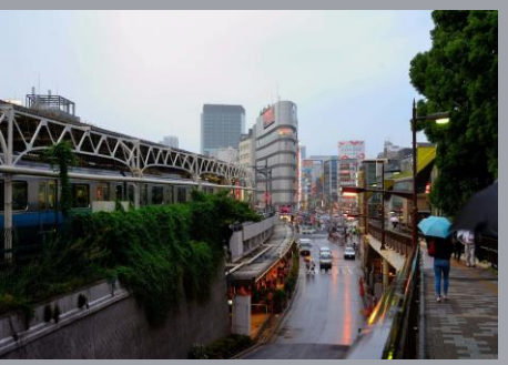
Japan May to July