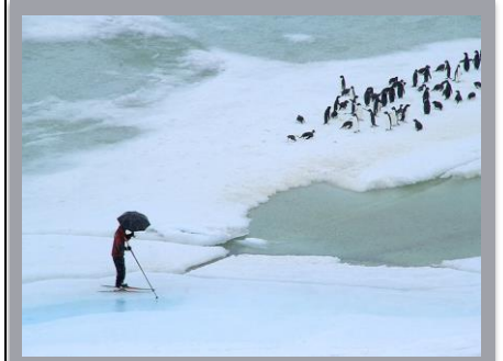
Antarctica November to March