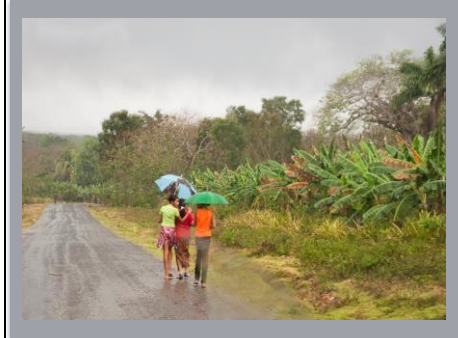
Caribbean June to November