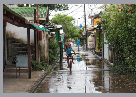
Costa Rica May to November