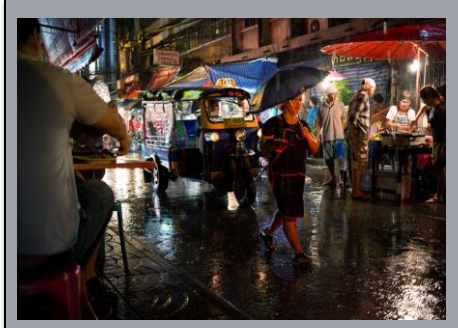
Thailand July to October