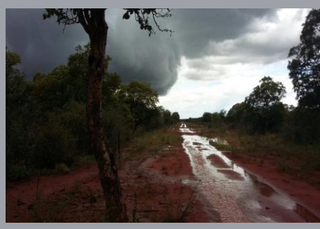
Northern Africa November to March